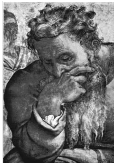
„Der weinende Prophet“

Michelangelo di Lodovico Buonarroti Simoni; 1475-1564; Ausschnitt aus den Deckenfresken der Sixtinischen Kapelle des Apostolischen Palastes im Vatikan